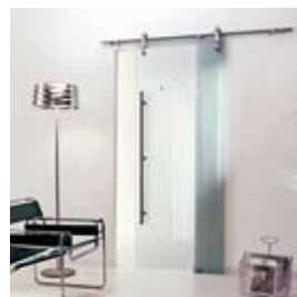
Matite (pág. 06)