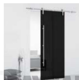
Black (pág. 09)