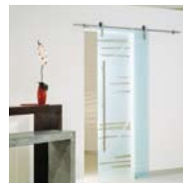
Graffio (pág. 07)