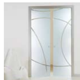
Legomme (pág. 18)