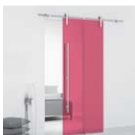
Cherry (pág. 08)