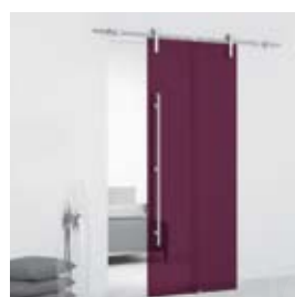
Plum (pág. 13)