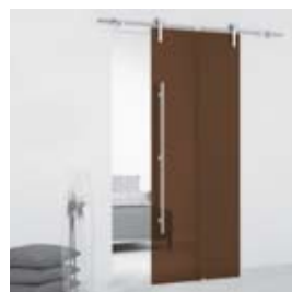
Cacao (pág. 08)