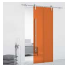
Apricot (pág. 08)