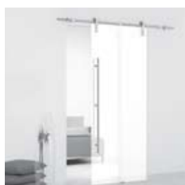
White (pág. 12)