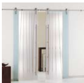
Asia (pág. 10)