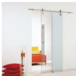
Transparente (pág. 04)