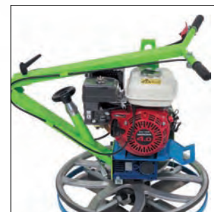
Manillar abatible para su fácil transporte