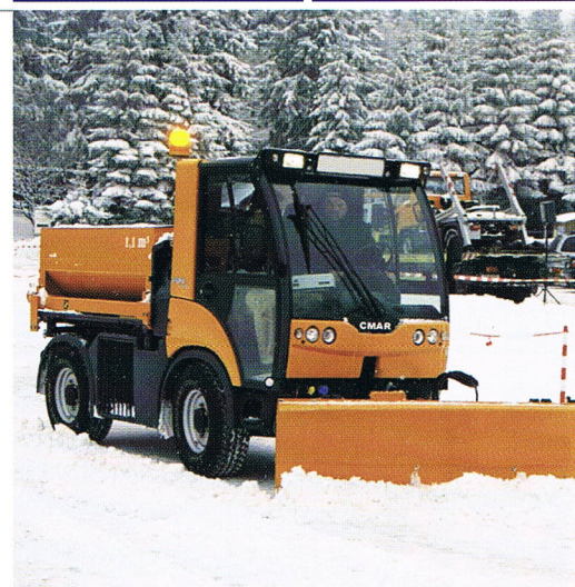
Configuración hibernal de la LC 860.