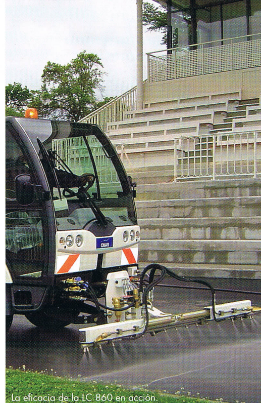
La eficacia de la LC 860 en acción.

Destacando en el sistema de lavado y atractiva por su diseño, revaloriza la imagen de su ciudad.