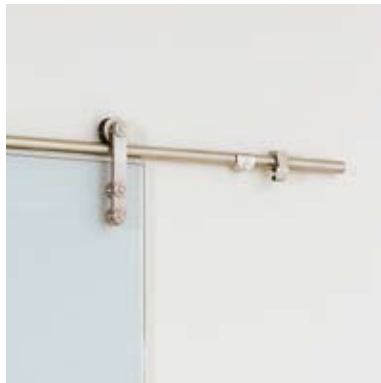
SYSTEM Puerta corredera vista