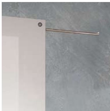
SYSTEM ZERO Puerta corredera vista