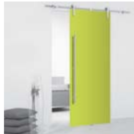
Lime (pág. 16)