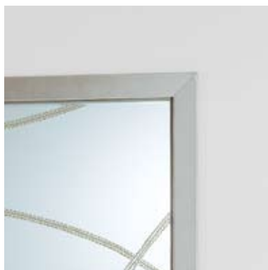
ORCHIDEA VETRO Puerta corredera oculta