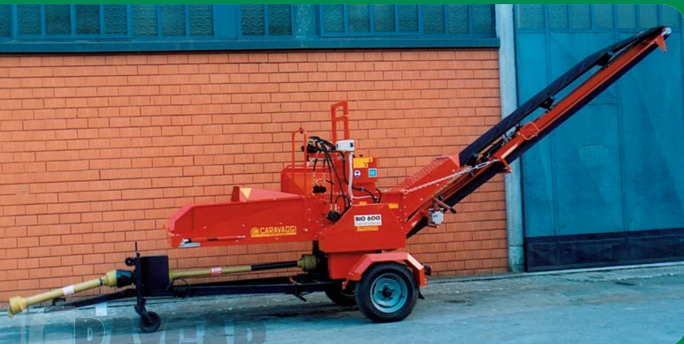
Bio 600 trattore, nastro 2,70 mt e carrello agricolo