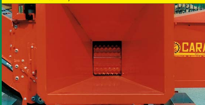
RULLO ALIMENTATORE CIPPATORE