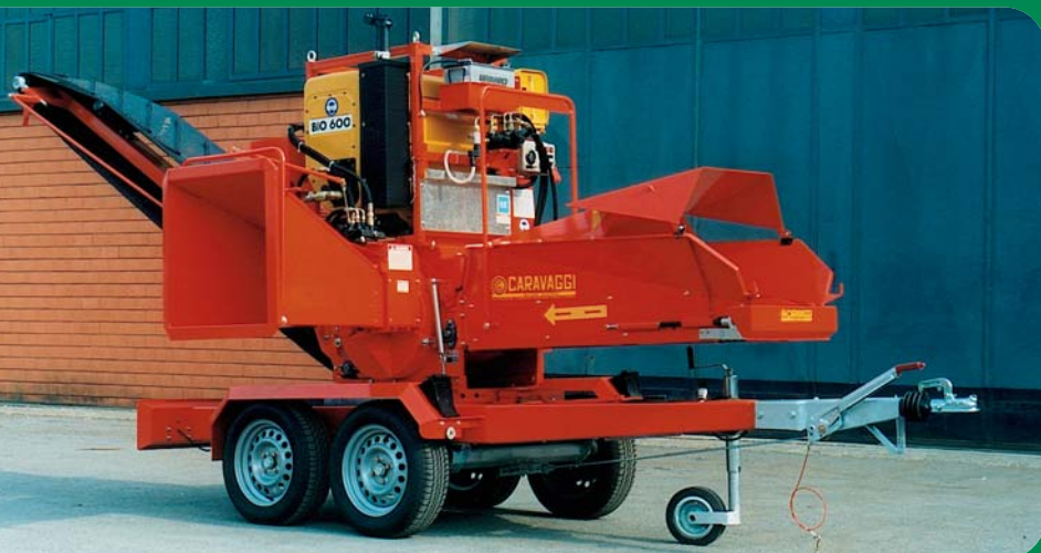
Bio 600 diesel 60 CV con nastro e carrello stradale