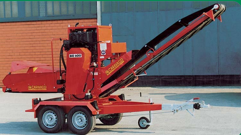
Bio 600 diesel 50 CV con nastro e carrello stradale