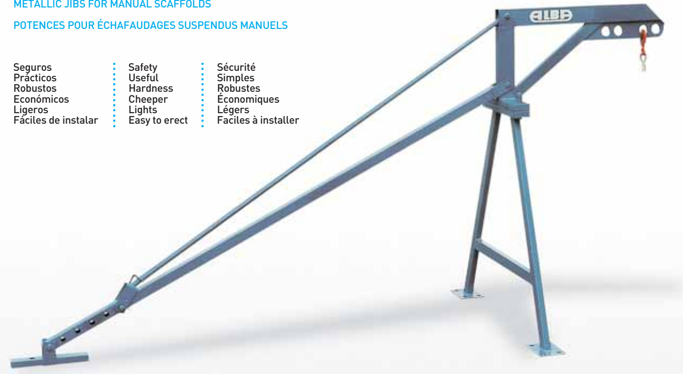
FIG. 5. Anclaje de PA-500 mediante contrapesos o mediante perforación de suelos (Sobre base metálica contrapesan 22 bloques de hormigón de 25 kg cada uno).

Seguros Safety Sécurité Prácticos Useful Simple Robustos Hardness Robust Económicos Cheaper Économiques Ligeros Lights Légers Fáciles de instalar Easy to erect Faciles à installer